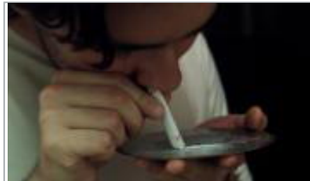
Un joven esnifa una raya de cocaína