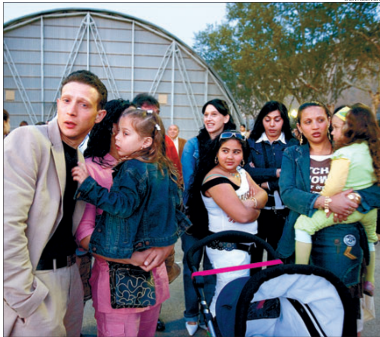
► Celebració del Dia Internacional del Poble Gitano, ahir a la nit, a la Font Màgica de Montjuïc.

Per intentar evitar aquesta discriminació que encara avui és manté, la Generalitat està portant a terme des de fa uns mesos l'anomenat Pla Integral del Poble Gitano. És un programa que engloba 13 conselleries en què es pretén posar en pràctica diverses polítiques per afavorir l'escolarització dels gitans fins a la