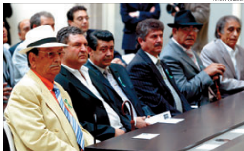
► Representants d'entitats gitanes, al Parlament, ahir.